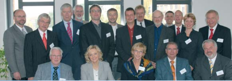
◀ Die Unterzeichnerinnen und Unterzeichner der Sicherheitspartnerschaft im Städtebau